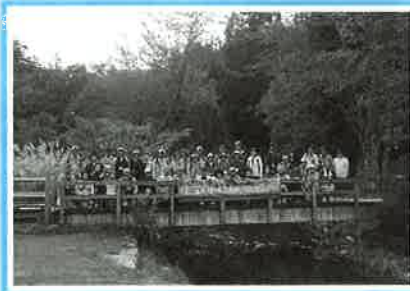
水を育むきららの森