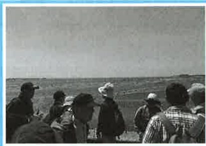
干潟が広がる前芝海岸

年4回のウォーキングを行い、豊川の上流から河口まで、名所・旧跡を訪れます。日本を貫く中央構造線が創った特異な地形地質、そこから生まれた自然、そして古くから今に伝わる人の営みを体感できます。私たちの活動が広く理解され、多くの人が関心を持ち、活動に参加されることを期待しています。